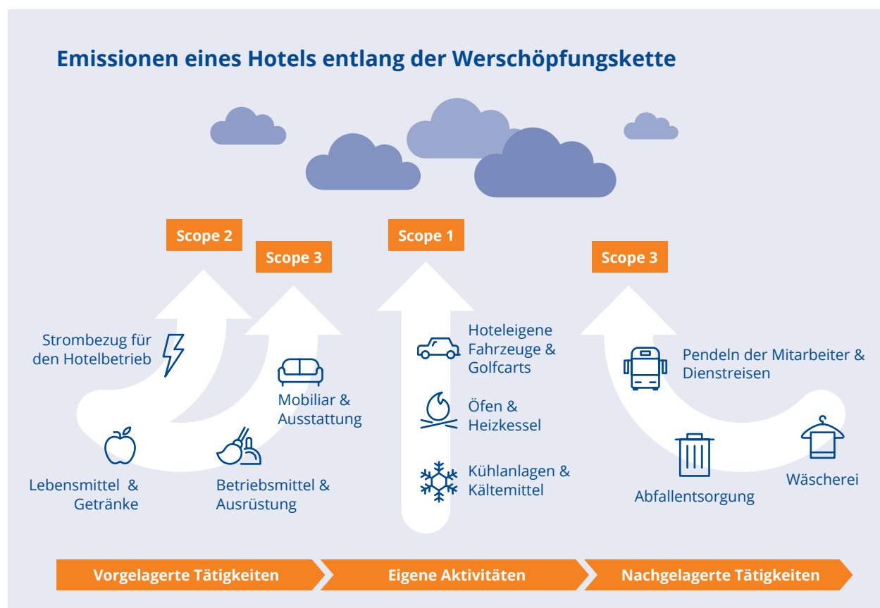
Abbildung: Eigene Darstellung in Anlehnung an Hotel CO 2 -Fußabdruck | sustainabletravel.org

Viele Dienstleister bieten eine professionelle Bilanzierung der Treibhausgase an, mittlerweile finden Sie auch eine Vielzahl an Anbietern, die auf eine Branche wie dem Gastgewerbe spezialisiert sind. Falls Sie noch keine eigenen NachhaltigkeitsexpertInnen im Unternehmen haben, lohnt sich meist die Zusammenarbeit mit einem zertifizierten Dienstleistungsunternehmen, die die CO 2 -Bilanzierung für Sie übernehmen – das spart Zeit und damit Ressourcen. Bei vielen Unternehmen liegen ein Großteil der Treibhausgasemissionen und Einsparmöglichkeiten außerhalb des eigenen Handlungsbereichs. Achten Sie bei der Auswahl Ihres Dienstleisters deshalb darauf, dass dieser auch Scope 3 mit einberechnet. Die Beschaffung der Daten von Scope 3 Emissionen sind in der Regel schwieriger und kosten womöglich etwas Zeit, aber gerade hier liegt das wichtigste Potenzial zur Einsparung. Eine Bilanzierung ohne Scope 3 Emissionen ist schlichtweg Greenwashing.